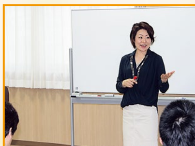
▲南相馬連続講座より

CTNエグゼクティブコーチ 統括責任者・首席講師、東京都出身。人間関係や能力開発に関する様々な分野のセミナー・講演・研修・執筆活動を展開。対象は企業、教育、医療機関、自治体、一般参加者対象の講座など多方面にわたり、機能するコミュニケーションを日本の文化にするべく精力的に活動中。テレビ・雑誌・新聞でも取り上げられる。講演・講座・研修は、全国で年300回以上。著書は、『ほめない子育て』『悩んでばかりの自分から抜け出す方法』『失敗する子は伸びる』『営業マンは頑張るな』『課長塾部下育成の流儀』など多数。