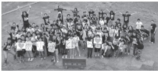
▲2011年8月に栃木県で開催した「のびのびキャンプ」

●連絡先●特定非営利法人ルワンダの教育を考える会 TEL024-533-8289