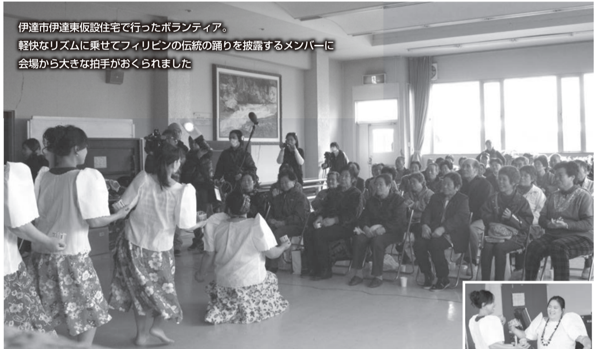
伊達市伊達東仮設住宅で行ったボランティア。 軽快なリズムに乗せてフィリピンの伝統の踊りを披露するメンバーに 会場から大きな拍手がおくられました

避難所の辛さがわかるからこそ、 少しでも元気づけたいと思って 始めたコーヒーサービス