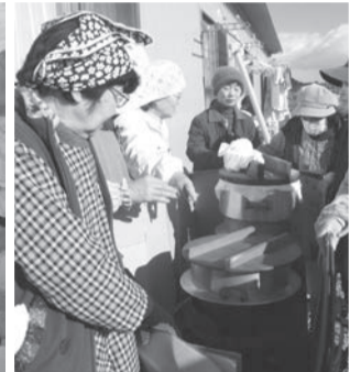
▲モチ米を蒸す釜場は、いわき市四倉地区民生児童委員の皆さんの担当