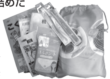
▲全国老人クラブ連合会の呼びかけて作られた「元気袋」

「餅つき大会」に参加された皆さんには、福島県老人クラブ連合会から届いた「元気袋」がプレゼントされました。「元気袋」は、全国老人クラブ連合会が被災された高齢者の皆さんに自分たちのまごころを届けようと全都道府県・市町村老人クラブへ呼びかけて製作したもの。袋の中には、ポケットティッシュや歯ブラシ、タオルなどの日用品が入っています。手作りの袋は、いろいろな柄があって皆さんどれにしようか迷いながら選んでいました。