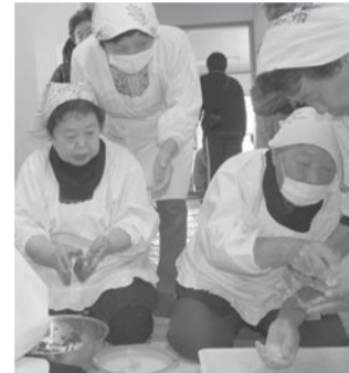
▲手際よく「あんこ餅」「きなこ餅」「おろし餅」を作る四倉地区高齢者クラブ連合会の皆さん