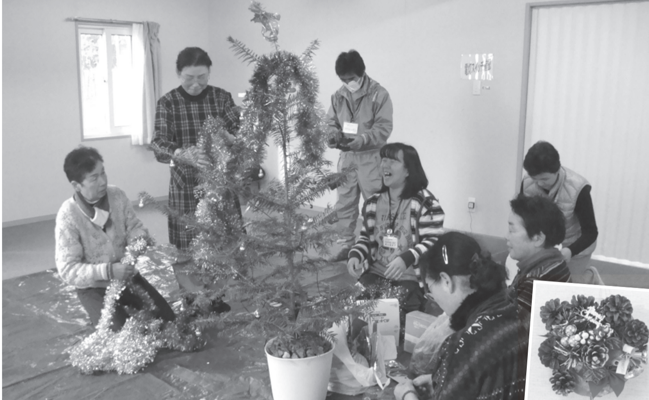
▲協力しながらツリーに飾りをつけていく皆さん。オーナメントは、大玉村社会福祉協議会からのプレゼント