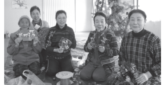
▲「うちにもほしい」と頼まれたリースを作る皆さん。「作る度に上手になるから、もしかしたらプロになれるかも」。素敵なジョークにみんなで大笑い

大玉村玉井にある大玉村安達太良応急仮設住宅には、富岡町から避難されている皆さん211世帯 419人が暮らしています。3カ所ある集会所を利用し、大玉村社会福祉協議会やJICA 二本松など、多くの団体の協力を得てサロンを開催しています。火曜日のサロンは、聖路加国際病院の看護師さんたちが被災された皆さんの健康管理で巡回されていたことをきっかけにスタートしました。木曜日は、A-coopの皆さんを中心に開催しています。サロンには毎回13人から15人くらいの参加があります。回を重ねるほどに自分達も役立つことをしたいという声がかかるようになり、仮設で一人暮らしをされている方を招いて昼食会を開催したことも。