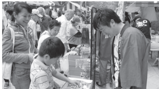
▲ [Mabuti naman at ayos ang kalagayan ninyo] [Opo. Mabuti naman ang kalagayan ko. Paki tulungan pa rin po ninyo ang Fukushima mula ngayon.]