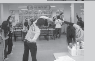
▲ Sa shelter sa loob ng Fukushima University ay natapos itayo noong Abril 30 (Abril 9, 2011)