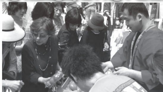
▲ Pagtinda ng mga espesyal na produkto ng perezpektura ng Fukushima [Proyekto para mapasigla ang Fukushima] Kasalukuyang ginagawa sa bawat bayan, tulad ng Tachikawa, Hachioji at Omiya. (Sa Yokohama Open Port Bazaar)

Ang aming layunin ay ang ipaabot sa bawat lugar ng buong bansa ang isang masigla na Fukushima, at paramihin ang mga nakaka-unawa ng kalagayan ng Fukushima.