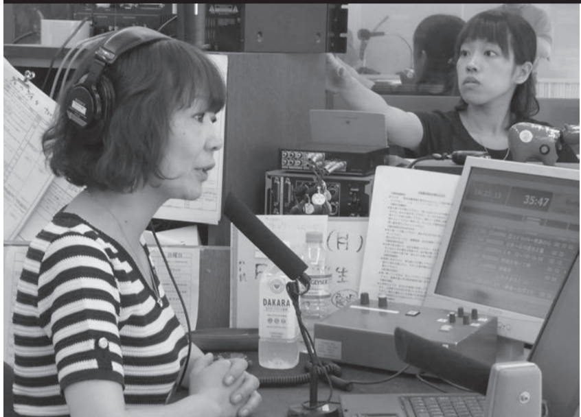
Ulat ng Boluntaryo 1 Iwaki City "Iwaki Citizens' Community Broadcast" (Palayaw: SEA WAVE FM Iwaki)

Hindi magamit ang telebisyon o telepono! Sa ganitong kaso... ~Ang Community FM ay lubhang nakakatulong na magkalat ng impormasyon sa panahon ng sakuna.