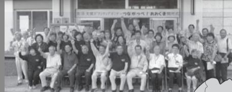
▲ Pagbubukas na Seremonya na ginanap sa local na Tanggapan ng Aizuwakamatsu sa Tanggapan ng Bayan ng Okuma. Gitna sa harap na hanay; ang Mayor at Tagapamahala rin ng Volunteer Center. Sabay na sinimulan ang paggamit ng sigaw na "Tsunagappe! Okuma" (Tayo nang Magkaisa! Okuma!)