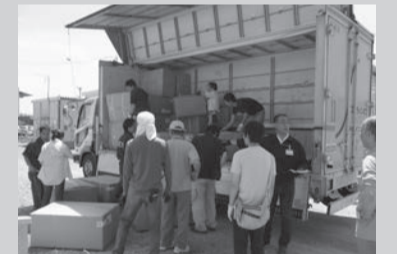
▲ Descarregamento de artigos de subsistência