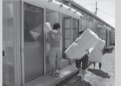
▶ Carregamento do conjunto de cobertas

O número de voluntários que participou nesta atividade foi cerca de 100 pessoas, sendo eles vindos de associação de bairro de 3 cidades próximas, do corpo de bombeiro, do clube de voluntário do Colégio de Fukushima, do grupo de voluntários em caso de desastre da SB Net de Fukushima, além de pessoas particulares. Apesar de ter sido um trabalho feito debaixo de um sol quente, graças ao trabalho enérgico de todos, a atividade terminou em uma hora.