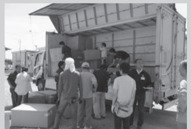
▲트럭에서 지원품을 내리는 작업