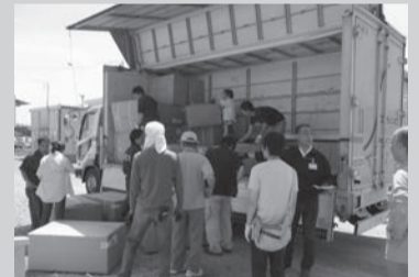
▲从卡车卸下支援品工作