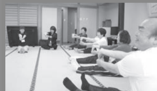
▲武内女士（左端）介绍：“我们也很推广沙龙活动。”