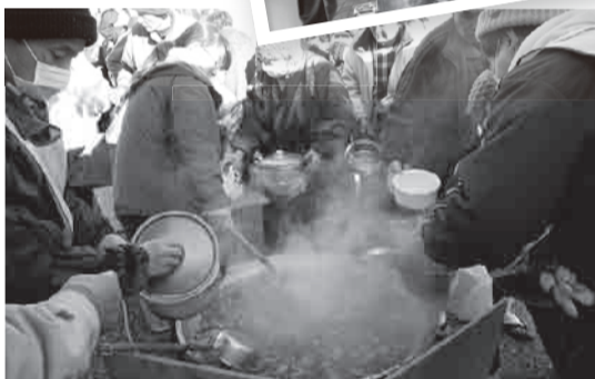
▲Ang ginawang pagluluto noong mga katapusan ng Marso sa Yotsukura sa Iwashi City. Nang anyayahay sa salu-salo, nagtipun-tipon ang mga taong hindi makagalaw na gamit ang kanilang mga sasakyan kaya hindi makapamili ng pagkain, ang bilis na naubos ang niluto na para sa 700 tao.