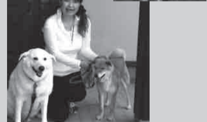
▲Naging magkaibigan na sila ni "Taro" na dati nang nakatira doon.