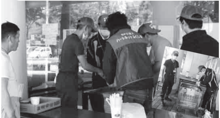
▲Ang kalagayan ng pagluluto ng tanghaliang isinagawa sa Parseizaka (Fukushima City) noong ika-6 ng Hunyo. Ang luto sa araw na ito ay [Misong Sabaw na may Toge]. Tinugunan ang kahilingan na [gusto naming uminom ng karaniwang misong sabaw] kaya kami ay nagluto kasama ang mga tauhan ng samahan.