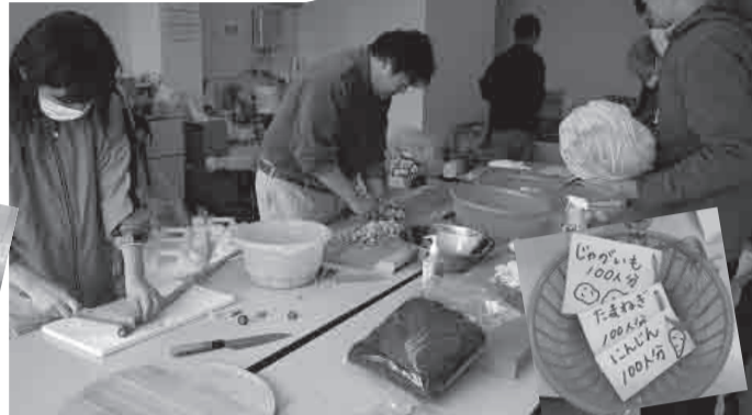
▲Ang ginamit na materyales sa pagluluto ay galing sa Perekaptura ng Miyazaki. Nagkaroon ng kaugnayan dahil sa pagtulong sa mga napinsalang magsasakang pamilya noong pumuputok ng bulakang Shinmoedake.