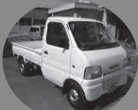
▲Ang maliit na trak na ibinigay sa Soma City Disaster Volunteer Center noong Mayo 14, 2011.