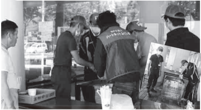
▲6月6日，在バルセイいざか(福岛市)提供午饭时的情况。这天的菜单是“豆芽大酱汤”。“想吃普通的大酱汤”，为了满足大家的要求，与联合的各位一起烹调。