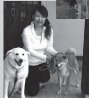
▲跟当地的原住狗“たろ”的关系也很友好