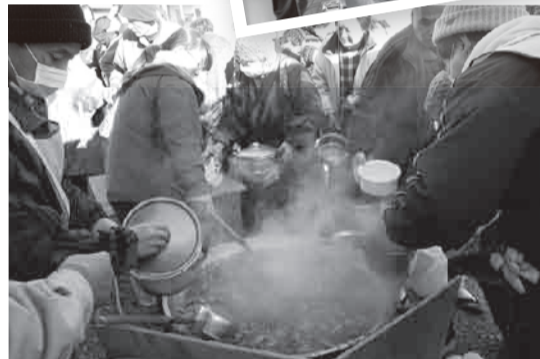
▲3月下旬，在いわき市四仓提供的饮食。招呼了一下，不能开车移动、也不能补充食品的人们就围了上来，700人的份餐一转眼就都没有了。