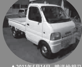
▲2011年5月14日，赠送给相马市灾害志愿者中心的小型卡车