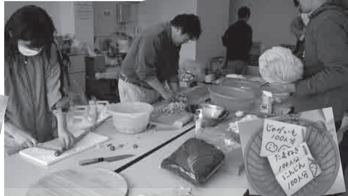
▲提供饮食使用的材料是宫崎县发来的。以由于新燃岳的喷火而受到流言伤害的生产农户的支援为契机而建立了良好的关系。