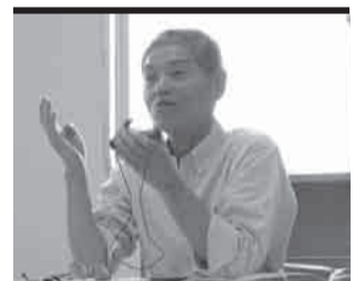
▲ [Ang mahalaga sa pagbantay sa mga tauhan na tumutulong sa pamumuhay ay ang pagpansin sa kahirapang dinadanas nila na hindi nila sinasabi. At ang pagbigay lunas sa kahirapang ito] ayon kay Ginoong Ogake (Kashiwazaki City Social Welfare Council)