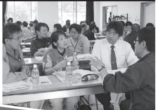
▲Pagkatapos ng lektura, pag-uusapan ang bawat kuru-kuro, bibigyan sangguni ang mga katanungan ng mga sumapi.