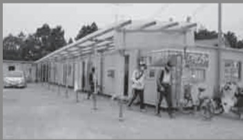
▲Ang 5 container house ay ang tanggapan ng general affairs sa una, ang tanggapan sa pangalawa, ang grupong namamahala sa pagtugma ng kinakailangan sa pangatlo, ang pag-uulat ng mga gawain sa pang-apat, at bodega ang pang-lima.