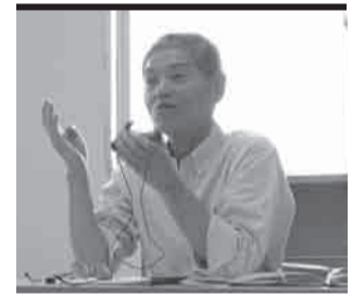
▲「생활지원상담원이 지켜볼 때 중요한 것은 말로 표현할 수 없는 괴로움을 알아차리는 것. 그리고 해결로 연결해 가는 것입니다.」 오가케 씨(가시와키시 사협)