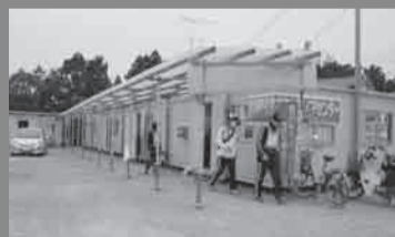
▲5동 콘테이너하우스는 1동이 총무, 2동이 접수, 3동이 너즈 매칭반, 4동이 활동보고, 5동이 자재창고로 되어 있습니다.