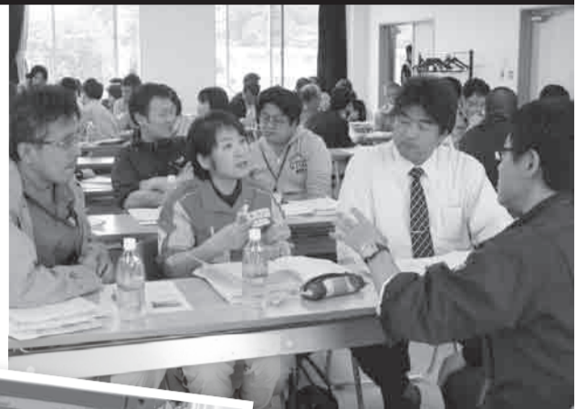
▲听完讲义以后，参加者们谈论各自的感想，就问题内容进行商量。