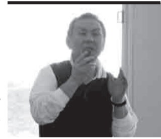
▲浅野先生（柏崎市社会福利协议会）说：“生活支援咨询员的工作内容涉及确认安全状况、受理志愿者活动、做活动企划和实施、与地区建立协作关系等各个方面。”

再过不久福岛县社会福利协议会在柏崎市社会福利协议会的各位人员的协助下，将一边进行实况调查一边启动制作《在过渡安置房内社会福利协议会的活动方针》。目标是使灾区恢复到震前的生活。把各种人力和救灾企划连接在一起来达成这个目标。