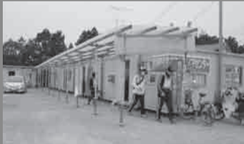
▲活动板房配置：第1栋是总务、第2栋是接待处、第3栋是供需匹配班、第4栋是活动报告处、第5栋是资材仓库