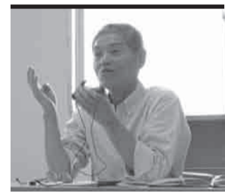
▲大挂先生（柏崎市社会福利协议会）说：“在生活支援咨询员做监护工作时，重要的是要注意到受灾者难以用语言表达出的痛苦。并着手去解决。”