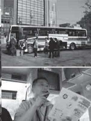
▲Tinaturo ng koordinador sa mga boluntaryo ang tamang gawain na dapat ang ipakita sa mga biktima.

Fukushima Disaster Volunteer Center ay may bus galing sa Iwaki City papuntang Shinchi-machi mula ika-3 hanggang ika-8 ng Mayo. Apatnapu't dalawang boluntaryo galing sa Fukuoka, Tokyo at Niigata ang nagalis ng putik sa lugar ng Onahama sa Iwaki City noong ika-4 ng Mayo. Ang sabi ng boluntaryo galing sa Fukuoka, "Ang mainam ay mga boluntaryo ang nakatulong sa mga biktima sa pagkat hindi na nila nagawa lahat -katulad ng pagalis ng putik sa may kanal malapit sa paktoriya at pagtanggap ng sako ng putik." Nararadaman ng mga boluntaryo sa loob ng bus ang pagmamalasakit nila sa mga biktima. Nalaman namin na ang miyembro ng pamilya ng driver ng bus ay hindi pa rin nakikita dahil sa Tsunami. "Mula noong araw ng lindol, madaming araw na dumaan na napakahirap subalit ngayon bumalik ang lakas ko dahil sa tulong niyo" sabi ng driver. Tinamaan kami sa sinabi ng driver, kaya gusto namin pasalamat ang lahat ng tumutulong.