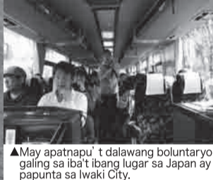
▲May apatnapu't dalawang boluntaryo galing sa iba't ibang lugar sa Japan ay papunta sa Iwaki City.