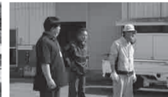
▲Pag naayos na ang lugar, makakagawa kami ulit ng masasapag na kamaboko (fish sausage) para maalala kung paano kami nagsimula ng negosyo" ang mga salita ng may-ari ng paktoriya.