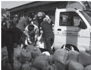
▲Ang huling trabaho ay dalhin ang mga sako sa ibang lugar.