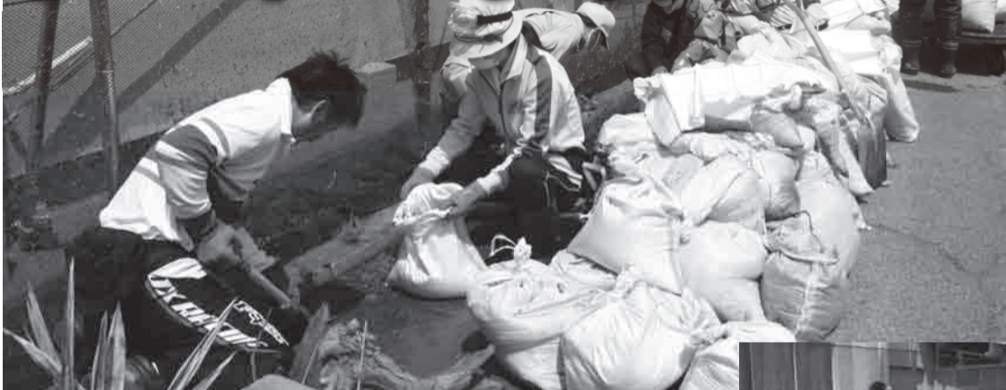
▲Sa tabi ng paktoriya ng kamaboko (fish sausage) na nagsimula pa noong panahon ng taisho na pinamamahalanang ng tatlong henerasyon, ang mga boluntaryo ang naglinis ng putik galing sa dagat.

Ang mainam ay matulungan ang mga taong nasalanta ng kalamidad sapagkat hindi na nila makayanang gawin ang lahat ng bagay.