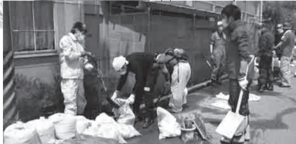
▲Ang ginawa namin ay tinanggal ang matigas at mabigat na putik at inilagay sa sako. Ito ay napakahirap na trabaho.