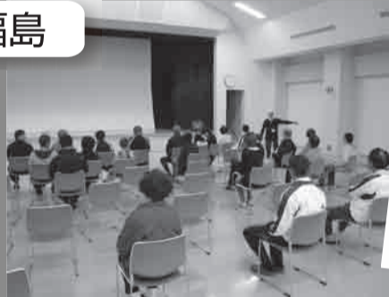
▲復興上映会の様子(JICA二本松)

「ドラえもん」など、「4月初め山形県最上町で開催したときは、南相馬市原町区と浪江町から避難されていた方が来てくださいました。飯豊町で開催したときは、上映会の前に南相馬市の様子をビデオレターとして映したところ大変喜ばれました。避難されているシニア世代は一番映画を観た世代。昔、感動した映画を見て少しでも元気になってもらえればと思っています