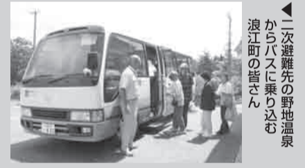
▲二次避難先の野地温泉からバスに乗り込む浪江町の皆さん

さん。浪江町の皆さんが避難されている二本松市内での移送サービスは、希望がある限り続けたいと思っているそうです。「移送サービスの常連さんがいる野地温泉は、浪江町臨時役場がある二本松市内から車で約1時間かかります。バスの中でのおしゃべりも楽しみにしておられるので可能な限り応えたいと思っています」。その後は、田村市に拠点を移し移送サービスの仕組みを根付かせて帰りたいと。「阪神大震災のときに助けてもらい、教えてもらったから今があります。今度は、私たちが支え伝える番です」。