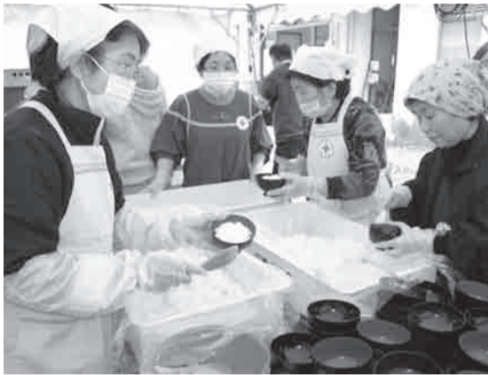
▲会津若松市女子赤十字奉仕団の皆さんは、避難所の炊き出しを1カ月間続けました。福島県内には147の奉仕団があり、1万4,000人の方が登録し活動しています

スキンシップによるリラクゼーション。▶ 「背中がポカポカするね」と避難されている方も思わず笑顔に