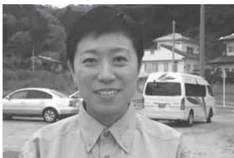
受害自愿者担当首相辅佐官 辻本 清美小姐

让受灾的诸位如此受苦受累心里感到痛心。我作为总理辅佐官和全国的自愿者们一起进行着支援活动。曾经去过两次福岛，希望今后继续和福岛的各位齐心协力干下去。