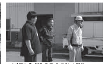
▲「부흥하면 원점으로 되돌아서 더욱 맛있는 어묵을 만듭니다.」고, 인사해 주신 공장주인(오른쪽)