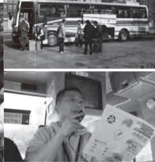
▲볼unteer 마을의 준비에 대해서 이야기하는 코디네이터

후쿠시마현 재해볼unteer센터에서는 피해지 지원으로서 5월3일부터 8일까지 이와키시와 신치마치간에 볼unteer 버스운행을 했습니다. 5월4일에 있었던 이와키시 오나하마지구의 진흙을 간 작업은 후쿠오카,도쿄,니이가타 등에서 42명이 참가했습니다. 「공장의 측도랑의 진흙을 가거나 흙부대 운방등, 지역주민만으로는 어쩔 수 없는 부분을 도와줄 수 있어서 좋았습니다.」라고 후쿠오카현에서 참가한 남성분은 말했습니다. 목적이 하나가 된 만석 버스는 이와키시행도 신치마치행도 피해한 분들을 생각하는 마음으로 가득 찼습니다. 이번에 신세를 진 버스 운전기사님은 쓰나미 피해로 인해 아직도 여전히 가족이 행방불명인지 여쭙았는데 「지진 재해 이래 힘든 날들이 계속되고 있었습니다. 그러나 오늘은 여러분에게 많은 힘을 받았습니다.」라고 해서 마음이 뜨거워졌습니다. 여러분 정말로 감사합니다.