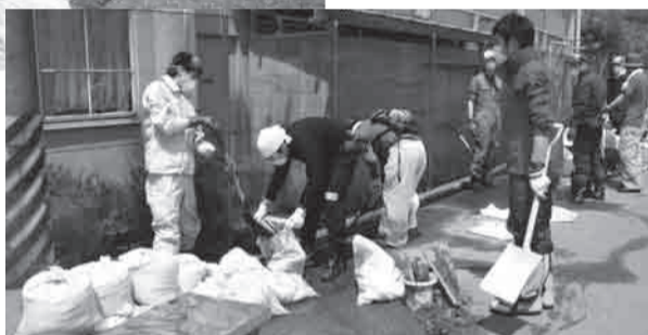
▲뒹뒹하고 무거운 진흙을 굵어모아서 채우는 착실한 작업입니다.