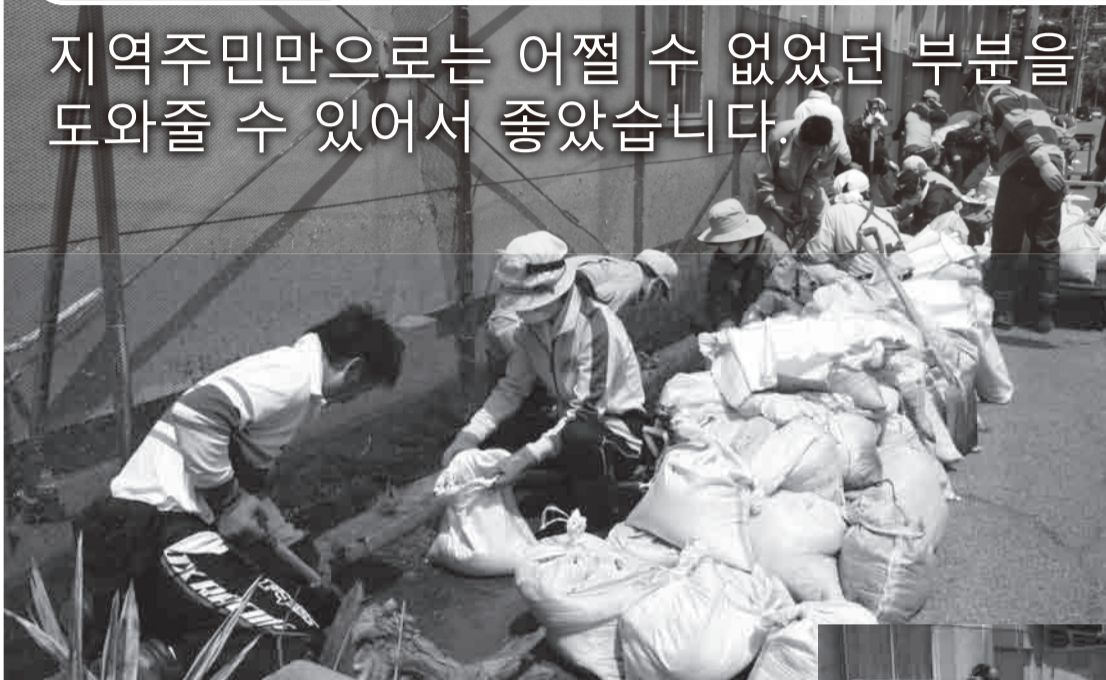
▲타이쇼시대 말기부터 3대 계속되는 어묵 공장의 옆에서 측도랑에 밀린 바다의 진흙을 가기 시작하는 볼unteer 분들

후쿠시마현 재해볼unteer센터에서는 피해지 지원으로서 5월3일부터 8일까지 이와키시와 신치마치간에 볼unteer 버스운행을 했습니다. 5월4일에 있었던 이와키시 오나하마지구의 진흙을 간 작업은 후쿠오카,도쿄,니이가타 등에서 42명이 참가했습니다. 「공장의 측도랑의 진흙을 가거나 흙부대 운방등, 지역주민만으로는 어쩔 수 없는 부분을 도와줄 수 있어서 좋았습니다.」라고 후쿠오카현에서 참가한 남성분은 말했습니다. 목적이 하나가 된 만석 버스는 이와키시행도 신치마치행도 피해한 분들을 생각하는 마음으로 가득 찼습니다. 이번에 신세를 진 버스 운전기사님은 쓰나미 피해로 인해 아직도 여전히 가족이 행방불명인지 여쭙았는데 「지진 재해 이래 힘든 날들이 계속되고 있었습니다. 그러나 오늘은 여러분에게 많은 힘을 받았습니다.」라고 해서 마음이 뜨거워졌습니다. 여러분 정말로 감사합니다.