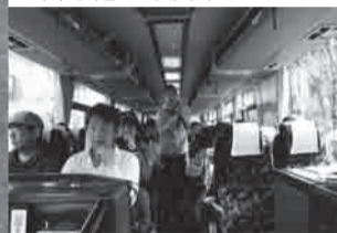
▲전국각지에서 참가해주신 42명의 볼unteer 분들을 태워서 이와키로