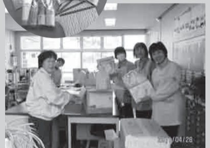
코마가미네 보육소에 왔습니다