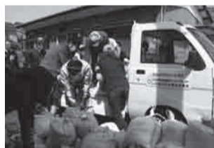
▲진흙을 채워넣은 흙부대를 옮겨서 종료입니다.