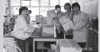
物品送到驹领的“こまがみね”托儿所