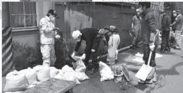
▲挖出又硬又重的泥巴再装袋是一项很单调而费劲的工作。

为了支援福岛县灾区，志愿者中心从5月3日至8日开通了岩手市与新地町间的免费巴士。有来自福冈、东京、新潟等地的42名志愿者参加了5月4日在岩手市小名滨地区的除泥工作。一位来自福冈县的男性志愿者谈到：“当地人们所无法解决的工厂旁水沟的除泥和搬运沙袋等问题，我们能够为他们提供一些帮助感到由衷的喜悦。”去岩手市和新地町的巴士都是满座，支援灾区的心愿将大家的心紧紧地连在一起。其实担任这次运行工作的驾驶员，其家属至今下落不明。“自震灾后，我一直痛苦度日。今天，大家使我振作起来。”他的一番发自内心的话温暖了大家的心。衷心感谢各位志愿者们所提供的帮助。