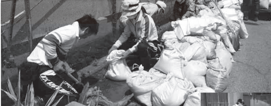
▲这是一家从大正末期开始已持续了三代的鱼糕工厂，志愿者们正在为工厂旁的水沟除泥

为了支援福岛县灾区，志愿者中心从5月3日至8日开通了岩手市与新地町间的免费巴士。有来自福冈、东京、新潟等地的42名志愿者参加了5月4日在岩手市小名滨地区的除泥工作。一位来自福冈县的男性志愿者谈到：“当地人们所无法解决的工厂旁水沟的除泥和搬运沙袋等问题，我们能够为他们提供一些帮助感到由衷的喜悦。”去岩手市和新地町的巴士都是满座，支援灾区的心愿将大家的心紧紧地连在一起。其实担任这次运行工作的驾驶员，其家属至今下落不明。“自震灾后，我一直痛苦度日。今天，大家使我振作起来。”他的一番发自内心的话温暖了大家的心。衷心感谢各位志愿者们所提供的帮助。