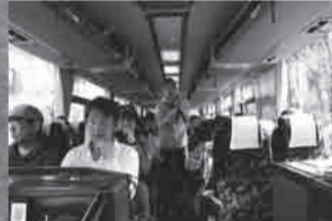
▲承载着来自全国各地的42名志愿者将奔赴岩手