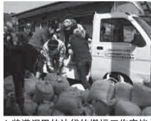
▲装满泥巴的沙袋的搬运工作完毕！