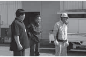
▲工厂经营者在问候大家时谈到“待复兴之时，将回归初心为大家提供更好吃的鱼糕”（右）