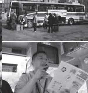
▲志愿者中心负责人正在为大家介绍志愿者应有的思想准备