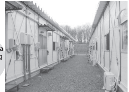
Appearance sa temporaryong pabahay (Shinchi machi)