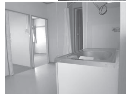
Loob nang temporaryong pabahay (Kori machi)