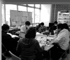
Estado do Centro de Voluntários em Caso de Desastres de Fukushima-ken

O Centro de Voluntários em Caso de Desastres de Fukushima-ken está estabelecido no 1º andar do Centro de Bem-Estar Social Geral de Fukushima-ken, baseado no item 1) Estatuto do Estabelecimento elaborado pelo Conselho de Voluntários em Caso de Desastres de Fukushima-ken.