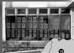
Mapa dos Centros de Voluntários em Caso de Desastres dos municípios, cidades e vilas

1) O que é o Conselho de Voluntários em Caso de Desastres de Fukushima-ken? O Conselho é formado por sete organizações a seguir: Sociedade Japonesa da Cruz Vermelha, Sucursal de Fukushima-ken, Conselho de Bem-Estar Social de Fukushima-ken, Liga Japonesa de Rádio Amador, Sucursal de Fukushima; Câmara Internacional Júnior do Japão, Distrito Tohoku, Conselho do Bloco de Fukushima; Heartnet Fukushima; Grupo Comunitário de Arrecadação de Fundos de Fukushima e três departamentos de órgãos administrativos da província de Fukushima. O Conselho de Bem-Estar Social de Fukushima-ken é responsável pela secretaria.